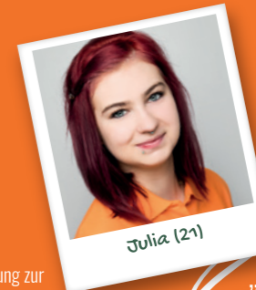
Ausbildung zur Pflegefachfrau

„ ... ich weiß, dass ich vielen Menschen jeden Tag etwas Gutes tue.“